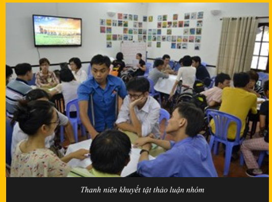
Thanh niên khuyết tật thảo luận nhóm

Sáng chủ nhật ngày 05/04/2015, tại Trung Tâm Khuyết tật và Phát triển (DRD) đã diễn ra buổi "Tập huấn về biến đổi khí hậu (BĐKH) cho thanh niên khuyết tật". Buổi tập huấn thu hút được sự tham gia sôi nổi của 30 bạn khuyết tật, do chính các bạn thanh niên khuyết tật Nhóm Đột Phá tổ chức, dưới sự hỗ trợ bởi Quỹ "Sáng kiến trẻ em và thanh niên với biến đổi khí hậu" của Trung tâm Sống và Học tập vì Môi trường và Cộng đồng (Live&Learn)