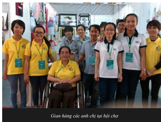
Gian hàng các anh chị tại hội chợ

Từ ngày 18-21/4/2015 đại diện 05 doanh nghiệp (Cở sở tranh thuê tay Dorcas; Cở sở In ấn Trần Diệu; Cở sở sản xuất hàng thủ công mỹ nghệ Diệu Linh; Cở sở Khung hình bút lửa Thanh Quốc và Công ty TNHH SX TM & DV Thiên Tâm) thuộc CLB Doanh nghiệp người khuyết tật TP.HCM tham gia bán hàng Hội chợ Quốc tế hàng Thủ công Mỹ nghệ, Đồ gỗ và hàng Quà tặng Việt Nam (Lifestyle Vietnam 2015) tại Trung tâm triển lãm và hội chợ Tân Bình - 446 Hoàng