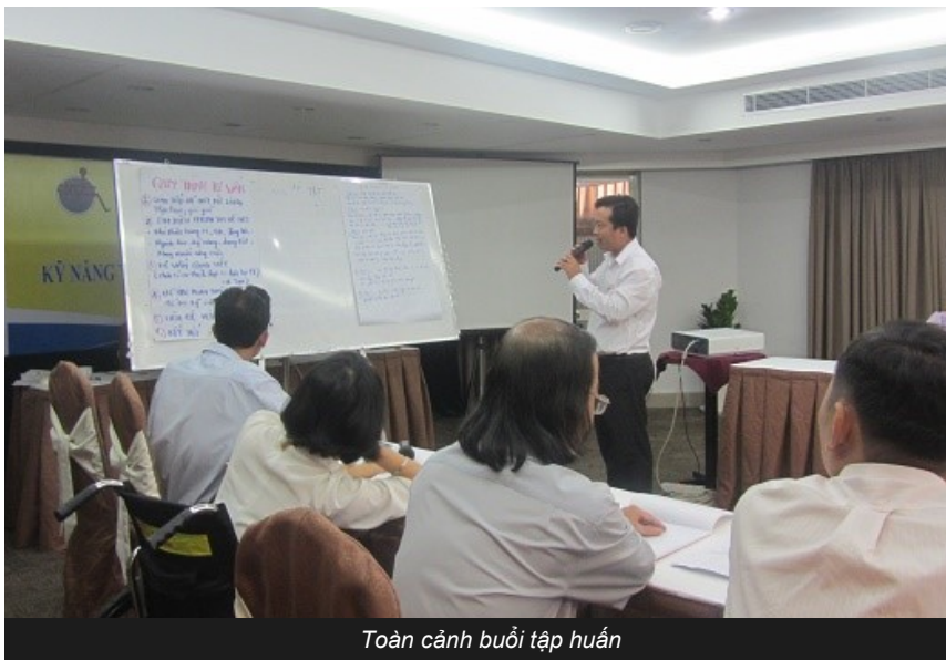
Toàn cảnh buổi tập huấn