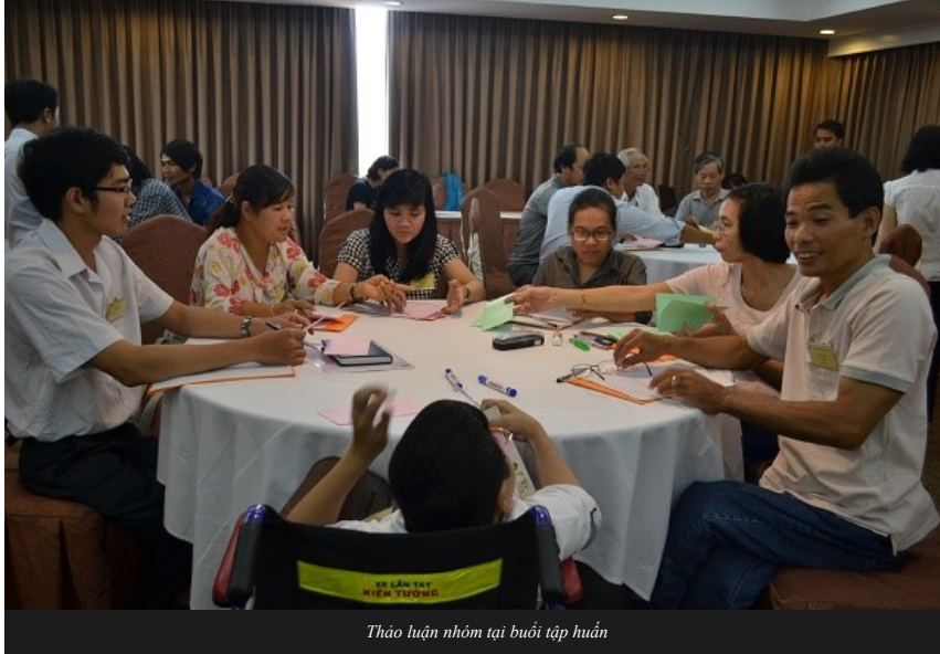
Thảo luận nhóm tại buổi tập huấn