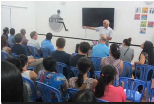
Đại diện nhóm MBA Chicago chia sẻ

Chiều ngày 21/6, Trung tâm Khuyết tật và Phát triển (DRD) đã có buổi giao lưu chia sẻ với nhóm sinh viên đang theo chương trình thạc sĩ quản trị kinh doanh (Master of