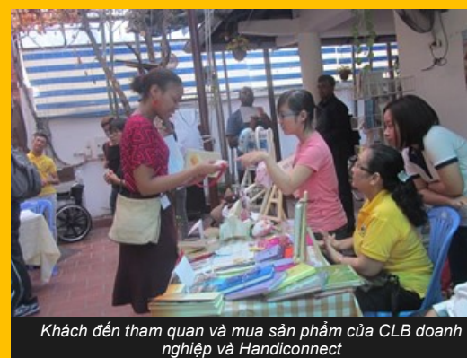
Khách đến tham quan và mua sản phẩm của CLB doanh nghiệp và Handiconnect

Handiconnect, CLB doanh nghiệp với các thành viên đang sinh hoạt tại DRD. Trong chuyến đến Việt Nam lần này các giáo sư và sinh viên chương trình Thạc Sĩ muốn tìm hiểu về Văn hóa – Kinh tế - Xã hội tại Việt Nam và các hoạt động hỗ trợ người khuyết tật của DRD tại Tp. Hồ Chí Minh, DRD đã giới thiệu về các hoạt động hỗ trợ người khuyết tật trong 10 năm qua như nâng cao năng lực cho người khuyết tật, nâng cao nhận thức của cộng đồng về các vấn đề liên