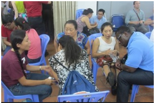
Hai bên thảo luận nhóm

Business Administration – MBA) từ Đại học Loyola, Chicago, USA. Buổi giao lưu có 45 người tham dự gồm 28 sinh viên Loyola, 14 các bạn thanh niên khuyết tật và tình