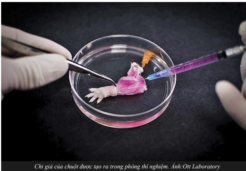
Chi giả của chuột được tạo ra trong phòng thí nghiệm.