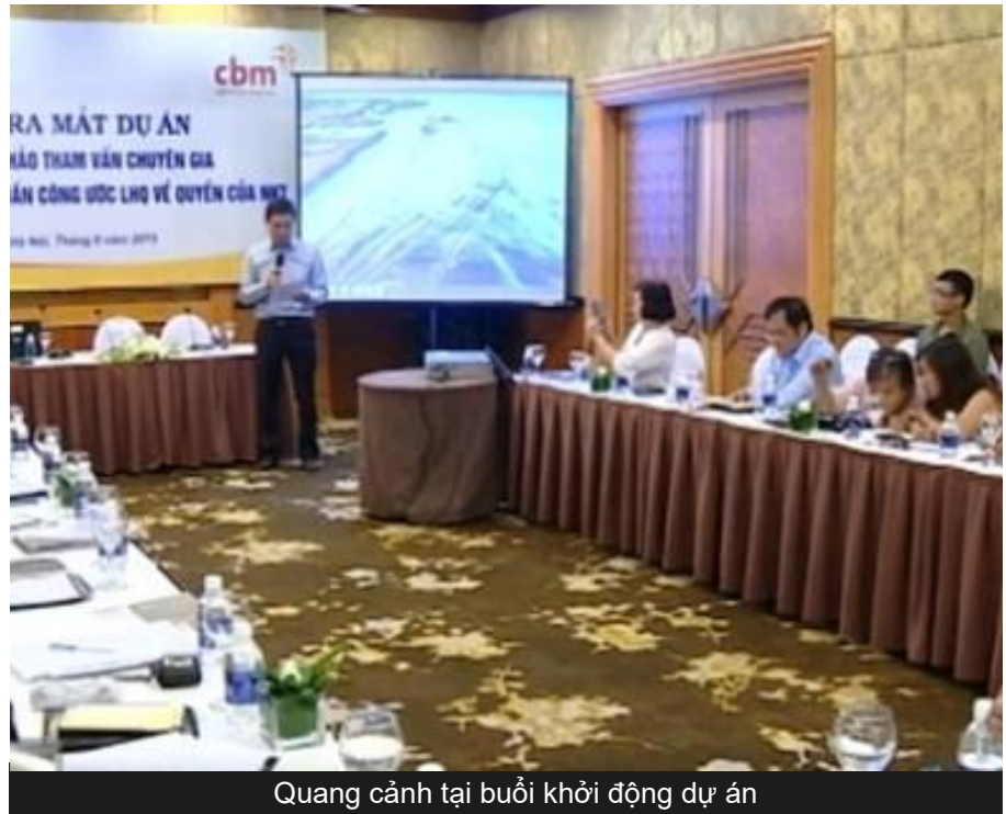
Quang cảnh tại buổi khởi động dự án