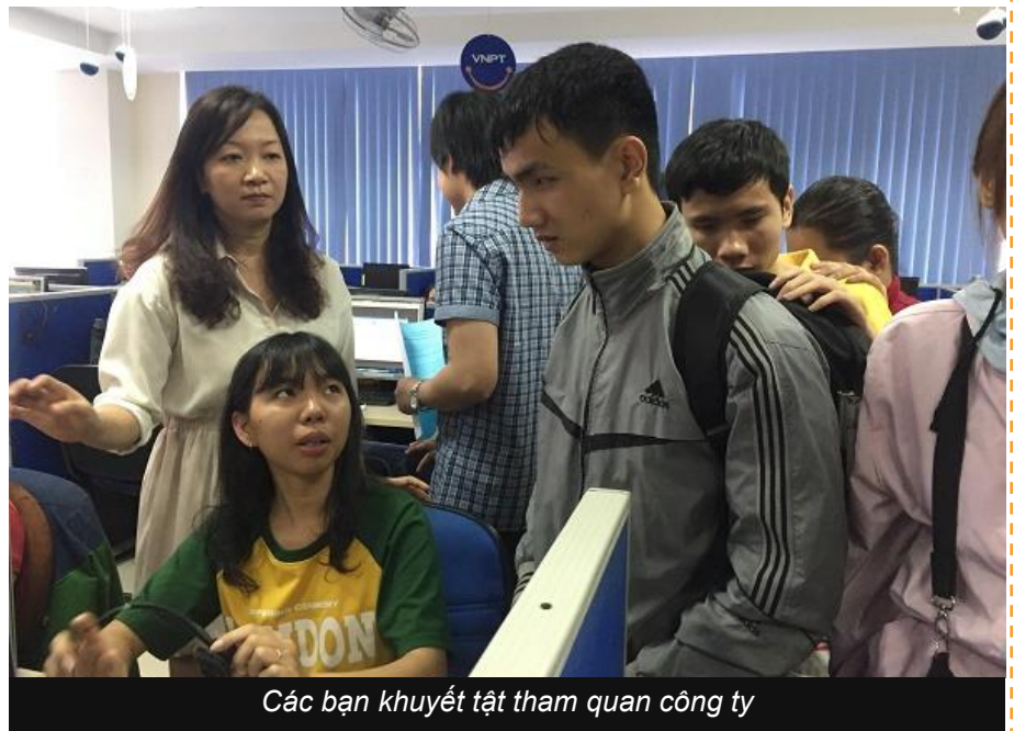
Các bạn khuyết tật tham quan công ty

nói chung, đặc biệt là những bạn khiếm thị nói riêng sẽ giúp người khuyết tật có cơ hội được thử sức với loại hình công việc này. Đặc biệt người khiếm thị sẽ có cơ hội được hỗ trợ trải nghiệm công việc, biết được những khó khăn và có những giải pháp/điều chỉnh thích hợp nhằm hỗ trợ người khuyết tật dễ dàng hòa nhập và tìm kiếm được một công việc phù hợp với khả năng cũng như tình trạng khuyết tật của mình.