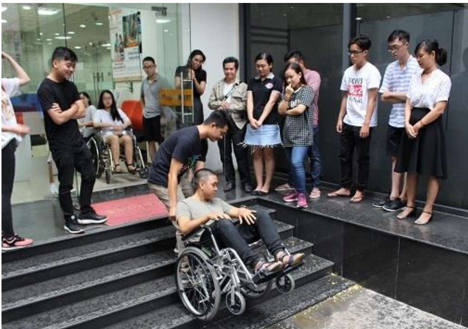
Cách đẩy xe lăn người khuyết tật lên bậc tam cấp