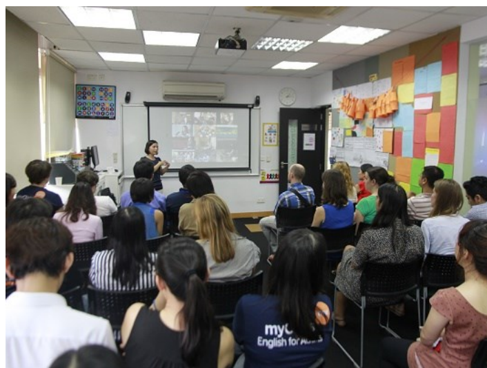
Không khí trải nghiệm khi là người khuyết tật của cán bộ nhân viên Hội đồng Anh