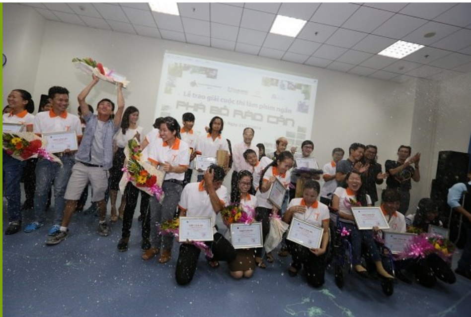
Các tác phẩm đạt giải