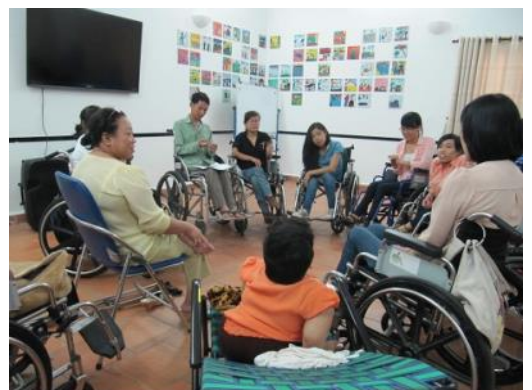
T toàn cảnh một buổi tham vấn đồng cảnh