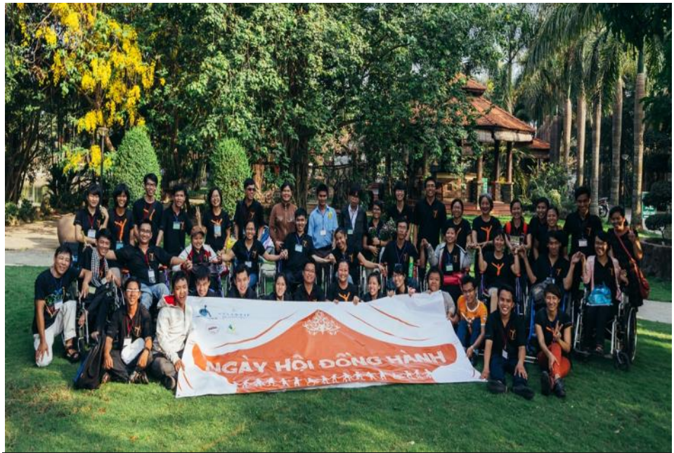
T toàn cảnh thanh niên và người đồng hành tại chương trình

Tất cả đều là những hình ảnh thanh niên sống đẹp cho mình và xã hội.