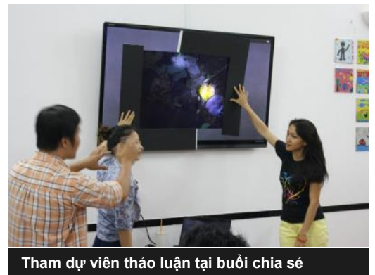
Tham dự viên thảo luận tại buổi chia sẻ