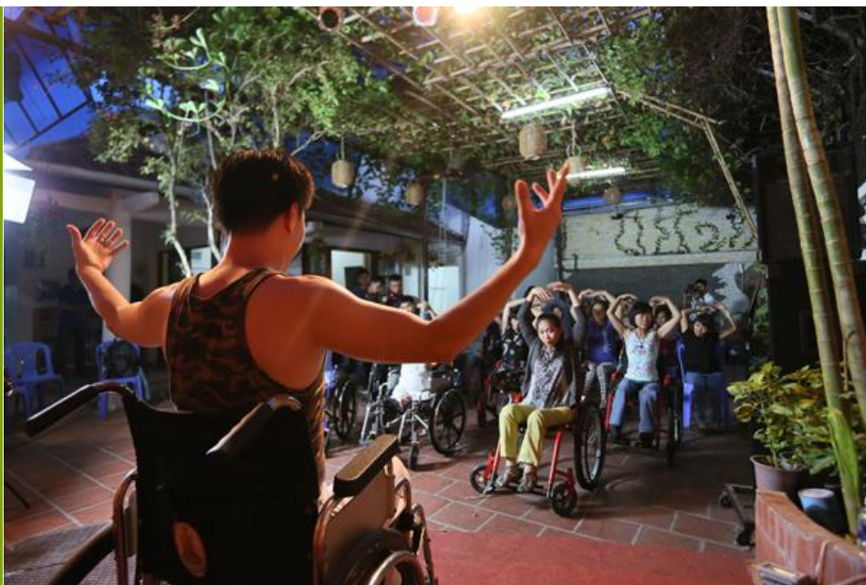
Khiêu vũ trên xe lăn thật sự được người khuyết tật đón nhận