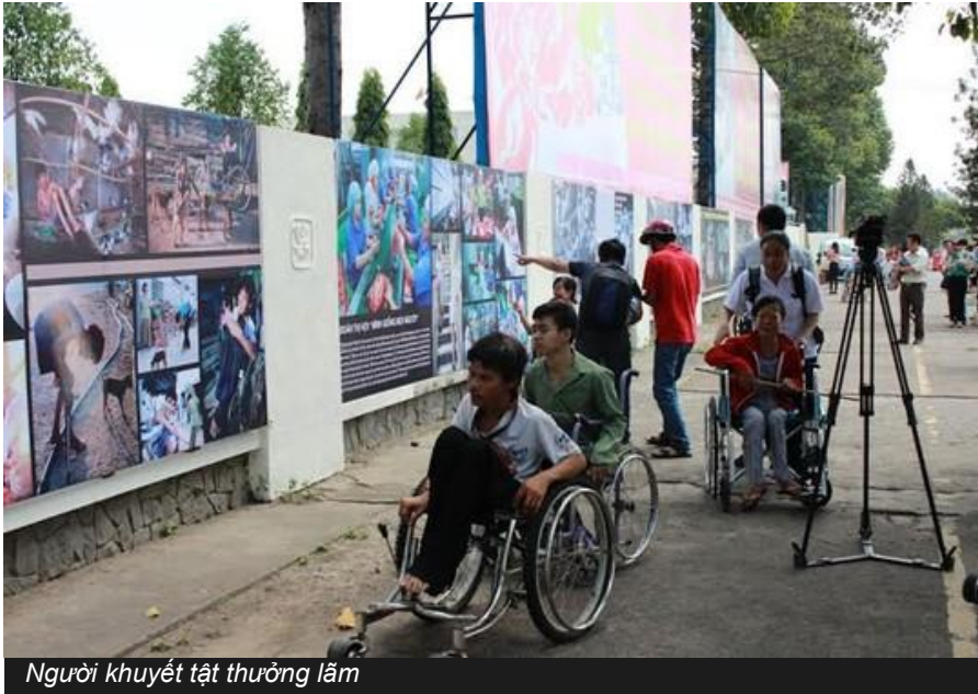
Người khuyết tật thưởng lãm