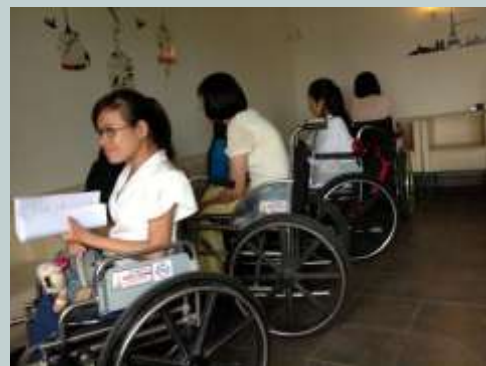
Trưởng nhóm hướng dẫn thực hiện các phiên tham vấn đồng cảnh