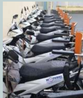
10 xe 3 bánh dùng trợ giúp NKT đi lại do KOICA tài trợ