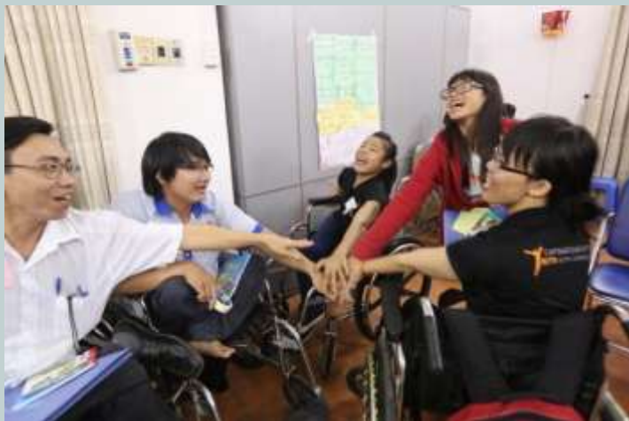
Thanh niên hào hứng thảo luận nhóm

Kết thúc khóa học, các bạn có được thêm kiến thức và kỹ năng cần thiết để "phá vỡ rào cản, hướng tới một xã hội hoà nhập" cho mình và cho những NKT khác, theo như chủ đề mà Ngày Khuyết tật Thế giới 3/12 năm nay kêu gọi.