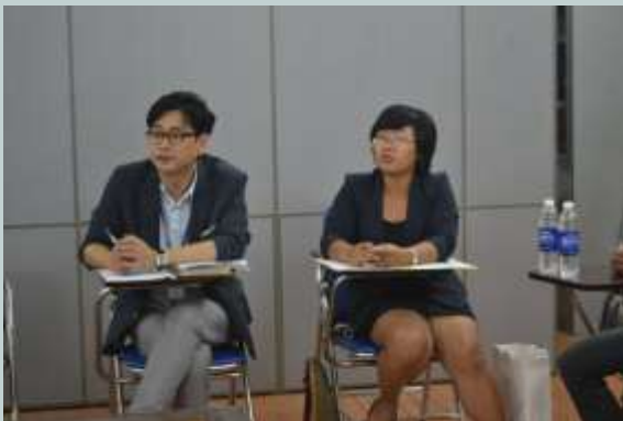
Ông Kang trao đổi với các cán bộ dự án về tình hình trợ giúp đi lại cho NKT

trợ từ phía chính phủ Hàn Quốc. Qua trực tiếp trò chuyện với các tài xế và quan sát sự vận hành của mô hình dịch vụ “Hỗ trợ di chuyển”, ông có thể hiểu được khó khăn của Người khuyết tật tại Việt Nam và đồng thời có nhã ý sẽ giúp đỡ nhiều hơn cho DRD trong thời gian tới trong khuôn khổ dự án.