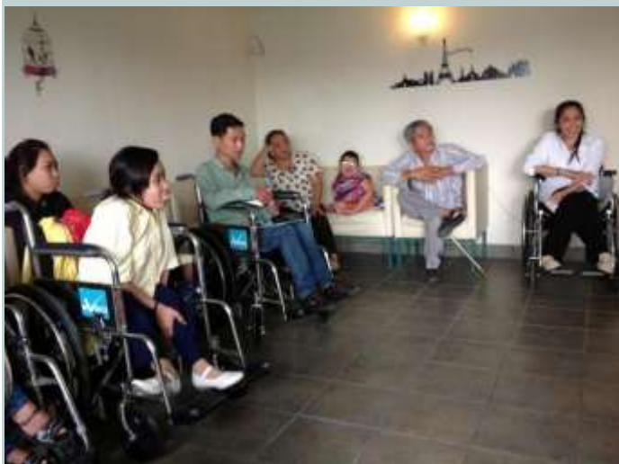
Tham dự viên vui về xây dựng mối quan hệ mới

Với mong muốn giúp người khuyết tật có cơ hội được lắng nghe và chia sẻ những trải nghiệm cuộc sống với các bạn đồng cảnh, ngày 22/09/2013, dự án Sống Độc Lập thuộc Trung tâm Khuyết tật và Phát triển – DRD, dưới sự tài trợ của Nippon Foundation và Hiệp hội Chăm sóc Con người Nhật Bản (Human Care Association) đã tổ chức tập huấn “Tham vấn đồng cảnh” cho 16 người khuyết tật, trong đó có 6 người lần đầu tham gia chương trình.