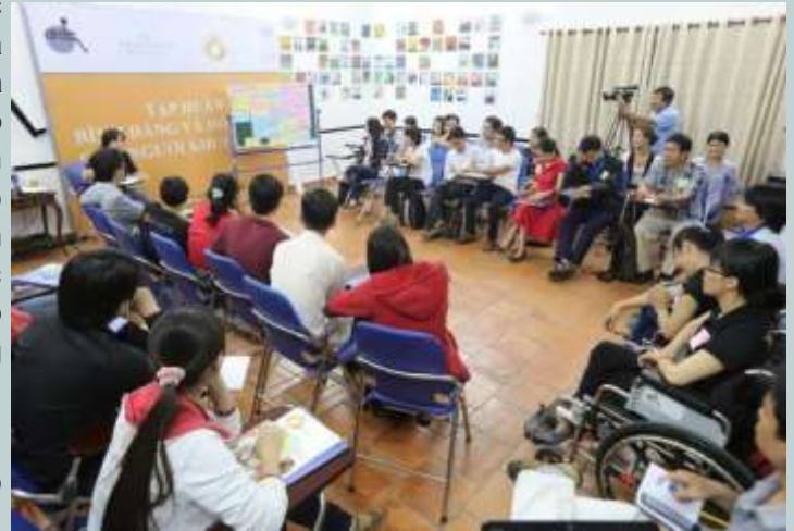
Toàn cảnh buổi hội thảo tập huấn

Thông qua các hoạt động đơn giản và thực tế như trò chơi, thảo luận nhóm, kể chuyện và đúc kết...theo phương pháp lấy học viên làm trọng tâm, các bạn trẻ có cơ hội trao đổi và học hỏi về Quyền con người và Luật về Người Khuyết tật Việt Nam; các mô hình hỗ trợ NKT; các rào cản mà NKT đang gặp phải; cách tạo điều kiện thích hợp cho NKT tham gia hoạt động xã hội; và đặc biệt là các công cụ vận động biện hộ để NKT hoà nhập một cách đầy đủ và trọn vẹn. Nhiều vấn đề đã được các bạn trẻ đưa ra thảo luận và lên kế hoạch