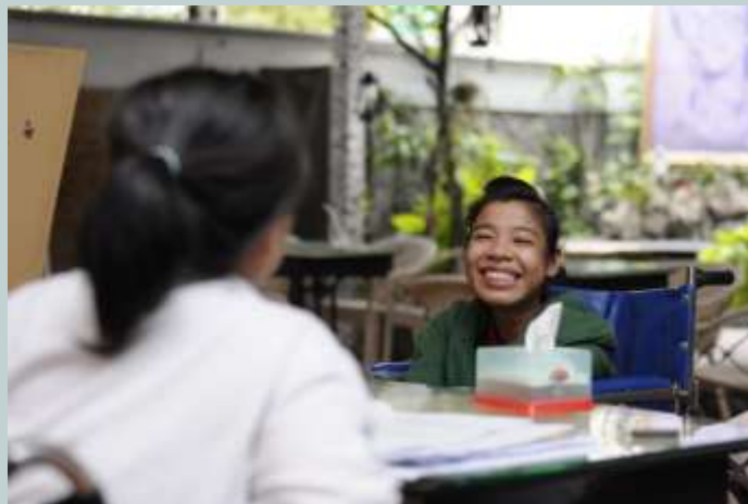
DRD hướng đến một xã hội không rào cản cho tất cả mọi người

Được thành lập vào 3/12/2005, DRD là một tổ chức phi chính phủ, phi lợi nhuận của và do người khuyết tật (NKT) điều hành và hoạt động vì quyền của NKT. DRD hiện đang cùng cộng đồng thực hiện mô hình hỗ trợ dựa trên quyền của NKT với nỗ lực thúc đẩy bình đẳng cơ hội cho NKT, khuyến khích và tạo điều kiện để NKT tham gia đầy đủ vào tất cả các hoạt động giống như những thành viên khác của xã hội.