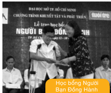
Học bổng Người Bạn Đồng Hành