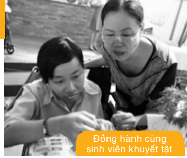
Đồng hành cùng sinh viên khuyết tật

DRD giúp người khuyết tật tự tin, nâng cao chất lượng cuộc sống trong môi trường không phân biệt đối xử bằng cách nâng cao nhận thức cho người khuyết tật và cộng đồng, nâng cao năng lực cho người khuyết tật, và vận động chính sách.