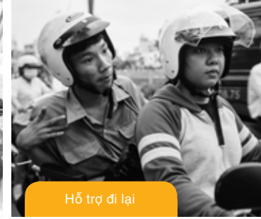
Hỗ trợ đi lại