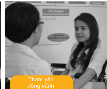
Tham vấn đồng cảnh