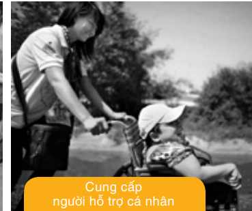
Cung cấp người hỗ trợ cá nhân