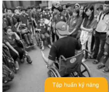
Tập huấn kỹ năng