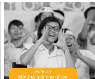
Sự kiện Một thế giới cho tất cả