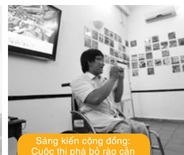
Sáng kiến cộng đồng: Cuộc thi phá bỏ rào cản